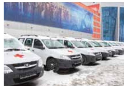
60 новых автомобилей «Лада Ларгус» для службы участковых врачей городских поликлиник

проживающих в муниципальных районах области. Плюс продолжается программа по развитию санавиации. За прошедший год более 700 сельских жителей получили высококвалифицированную медицинскую помощь, более 500 из них оперативно доставлены в специализированные центры Омска.