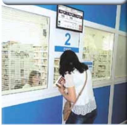
Регистратура БУЗОО «Клиническая медико-санитарная часть №7»

В 2018 году во всех поликлиниках Омска будет реализован проект «Бережливая поликлиника». Это позволит повысить доступность и качество медицинской помощи населению за счет создания комфортных условий пребывания, информированности граждан о медицинском обслуживании, снижения времени пребывания в учреждении и разделения потоков пациентов. Опыт реализации пилотного проекта в четырех медучреждениях (медико-санитарная часть №7, городская поликлиника №13, детская поликлиника №5, детская больница №4) дал положительный результат: время от входа пациента в поликлинику до его выхода в среднем сократилось в три раза.