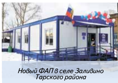
Новый ФАП в селе Заливино Тарского района

В соответствии с новым майским Указом Президента от 7 мая 2018 года за шесть лет в регионе необходимо обеспечить оптимальную доступность для населения, в том числе для жителей отдаленных населенных пунктов, медицинских организаций, оказывающих первичную медико-санитарную помощь. В 2018 — 2020 годах увеличено финансирование государственной региональной программы «Раз-